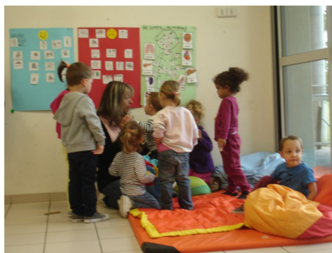
Matinée d'éveil au centre de loisirs de Monclar d'Agenais Le 25 septembre 2019