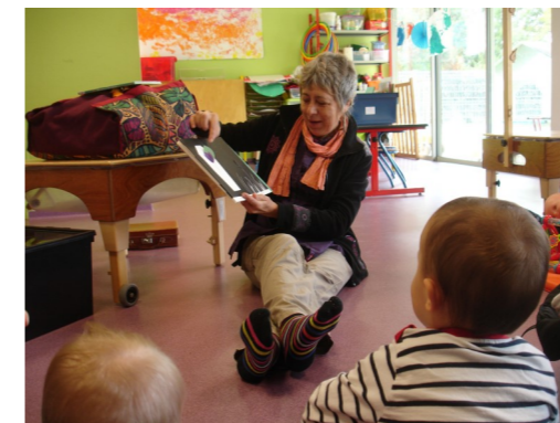
Matinée d'éveil à Castelmoron/lot Le 26 septembre 2019