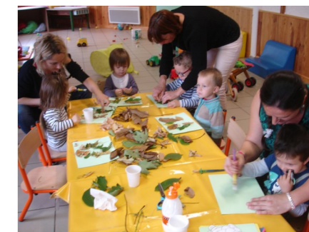
Matinée d'éveil à Verteuil d'Agenais Le 03 octobre 2019